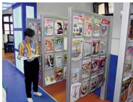
V první místnosti je čítárna s denním tiskem a časopisy.

na výrazně mění k lepšímu. Opravená je fasáda, hudební a dětské oddělení a nyní i studovna s čítárnou. Je to i díky tomu, že lidé ve vedení knihovny mají svou práci rádi,“ zhodnotil proměny knihovny ná-