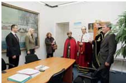
Tří králové navštívili jako už tradičně také olomouckou radnici.

Více na www.smv.cz nebo na tel. 840 668 668 – 24 h denně havárie i zákaznické záležitosti. (movo)