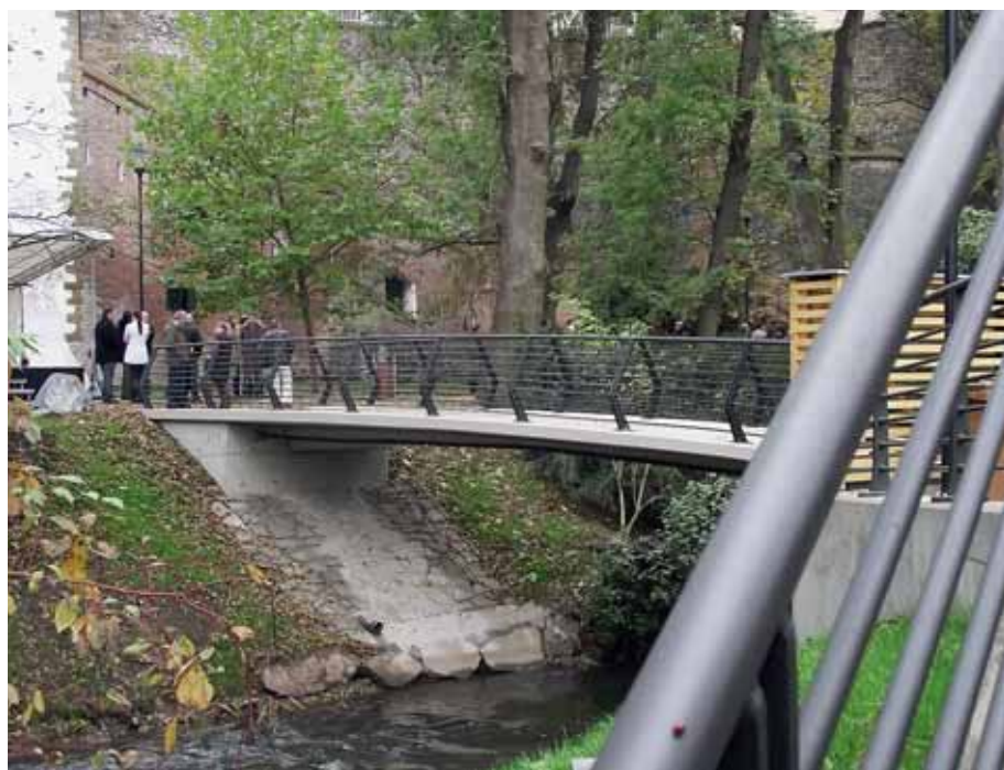
Také nová lávka v Bezručových sadech vznikla díky investiční aktivitě města.

muselo realizovat v mnohem větší míře ze svého.