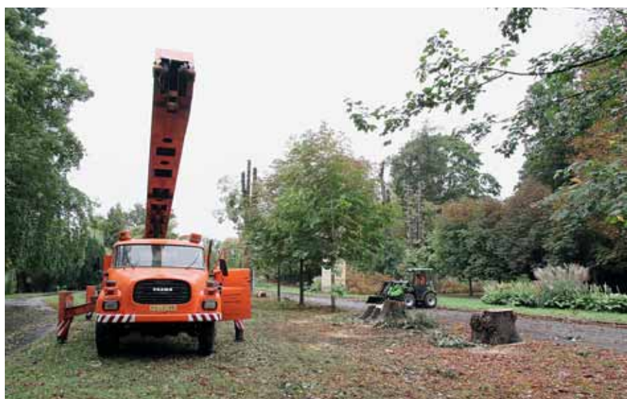
Smetanovy sady a další olomoucké historické parky procházejí důkladnou obnovou.