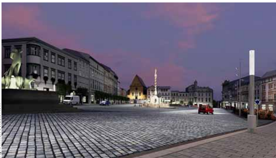
K největším letošním investicím bude patřit rekonstrukce Dolního náměstí.

Za prvé – jsme v závěrečné fázi období, v němž lze čerpat ve velkém dotace z EU. Plánovací období, v němž se v posledních letech hospodaření s fondy EU nachází, potrvá ještě tento a příští rok. Poté nastane další plánovací období, v němž se ale dost možná budou rozdělovat za prvé menší peníze a za druhé do výrazně jiných projektů. „Příští období bude mnohem méně velkorysé vůči projektům, zaměřeným na tvrdou infrastrukturu, větší akcent bude kladen na projekty z oblasti vědy, inovací a konkurenceschopnosti,“ vysvětloval na loň-