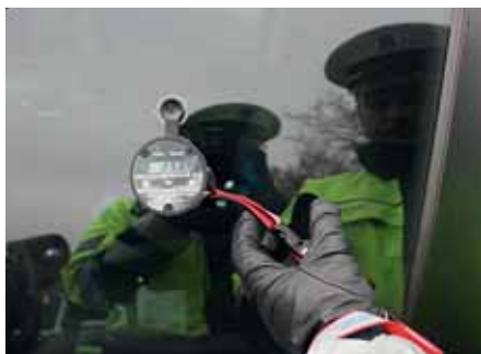
Pozor na to, s jakými skly v oknech svého vozu jezdíte.

„Na základě požadavků řidičů z Olomoucka jsme se rozhodli uskutečnit kontrolní