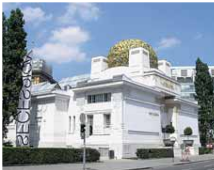
Na Pavilon Secese jsou dnes ve Vídni pyšní, před sto lety jej ale tvrdě odmítli.

Agresivní i vulgární reakce na moderní architekturu však nejsou ničím novým. Chrám rosniček, pozlacená zelná hlávka, kříženec skleníku a vysoké pece, skvrna na obrazu Vídně, atentát na dobrý vkus – tak označovali Vídeňané na přelomu 20. století dnes opěvovaný Pavilon Secese. Muzeum umění Olomouc se k vášnivé diskusi vrací výstavou, která v názvu parafrázuje hodnocení pavilonu Secese – Architektura je atentátem na dobrý vkus! Přehlídka, která potrvá do 22. dubna, nabídne divákům možnost srovnání jak s podobnými evrop-